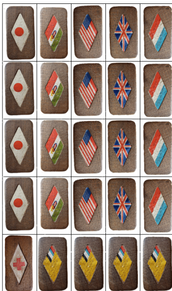
— 取りとせん 全部取りとってね