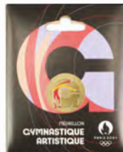
2024年パリ大会アルファベット スポーツメダル(体操競技)