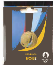
2024年パリ大会アルファベット スポーツメダル(セーリング)