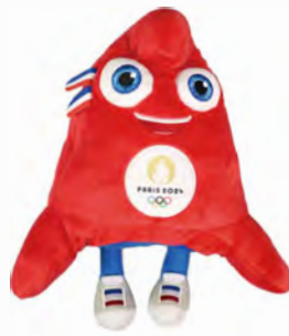
オリンピック・フリージュ