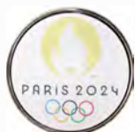
2024パリ大会 ロゴマークメダル(表面)