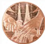
2024年パリ大会 ハンドオーバー 1/4ユーロコイン