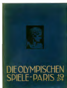
「1924年パリオリンピックの記録」 (独文版)