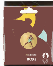
2024年パリ大会アルファベット スポーツメダル(ボクシング)