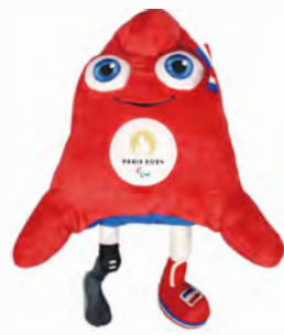
パラリンピック・フリージュ